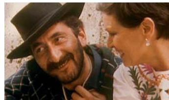
Daniel Schmid und Lucia Bose

Zum Kinostart des Dokumentarfilms DANIEL SCHMID - LE CHAT QUI PENSE am 02. September zeigen wir eine kleine Filmreihe mit Filmen des 2006 verstorbenen Schweizer